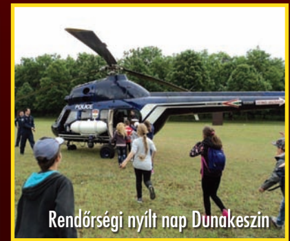
Rendőrségi nyílt nap Dunakeszin