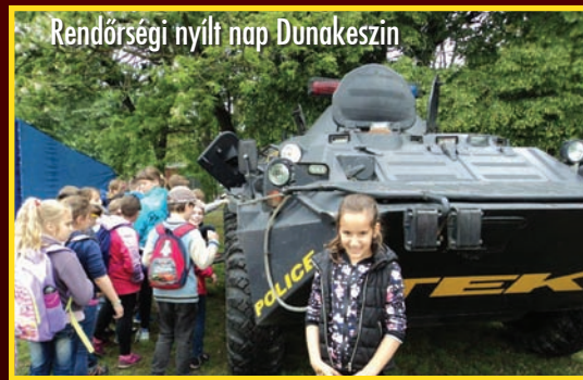
Rendőrségi nyílt nap Dunakeszin