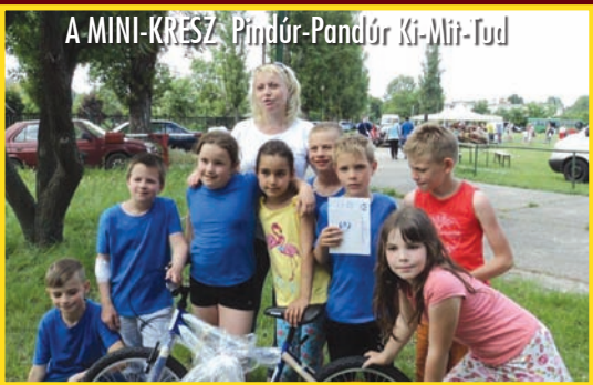
A MINI-KRESZ Pindúr-Pandúr Ki-Mit-Tud