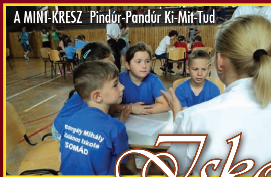
A MINI-KRESZ Pindúr-Pandúr Ki-Mit-Tud