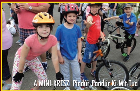
A MINI-KRESZ Pindúr-Pandúr Ki-Mit-Tud