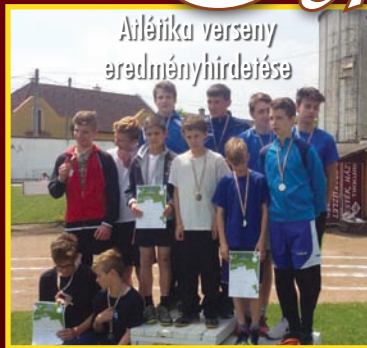
Arléika verseny eredményhirdetése