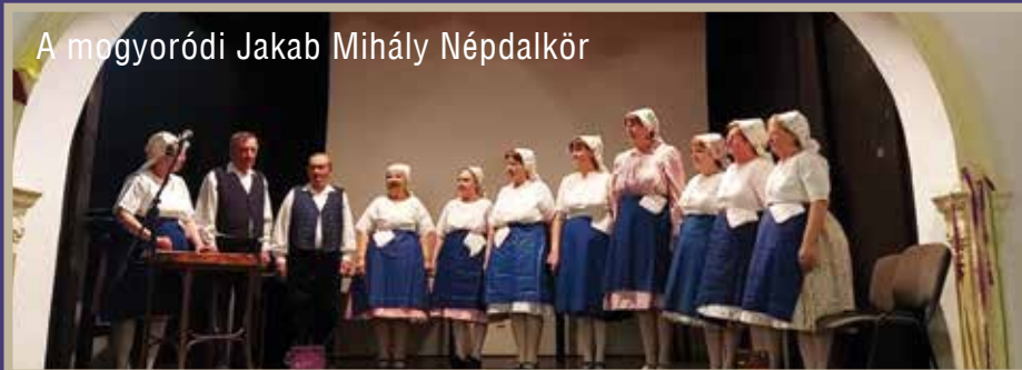
A mogyoródi Jakab Mihály Népdalkör